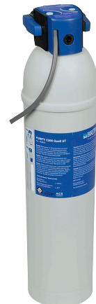
PURITY C 300 Quell ST 4.000 liter