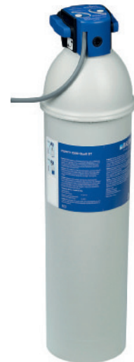
PURITY C 500 Quell ST 6.800 liter