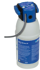
PURITY C 50 Quell ST 960 liter